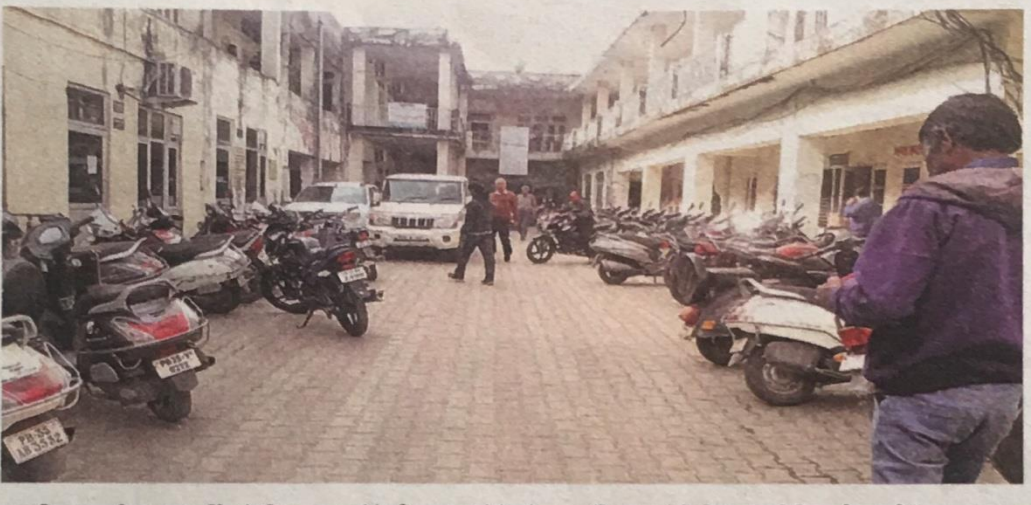
नगर निगम कार्यालय जहां पार्किंग के लिए जगह न होने की समस्या को देखते नया ऑफिस बनाने के लिए जगह चिन्हित की जा रही है 💿 जागरण

2014 में तत्कालीन राज्य सरकार ने पठानकोट नगर कौंसिल को नगर निगम का दर्जा दिया। वर्ष 2015 में चुनाव हुए और निगम का गठन हो गया। तीन वर्ष बीतने जाने के बाद भी निगम की ओर से जब कोई मीटिंग बुलाई जाती है तो वह वर्तमान कार्यालय की बजाय स्वीमिंग पूल कांप्लेक्स झल में की जाती है। कारण, निगम के 50 पार्षदों के बैठने के लिए अभी तक कोई उचित स्थान नहीं है। मेयर कार्यालय में सभी पार्षदों व अधिकारियों को एक साथ लेकर मीटिंग नहीं कर पाते।